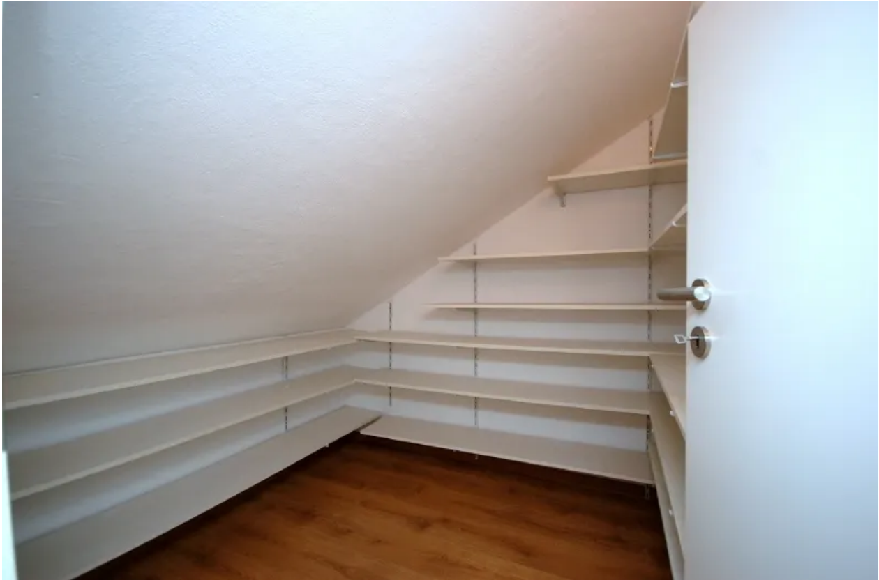
Kammer neben Schlafzimmer