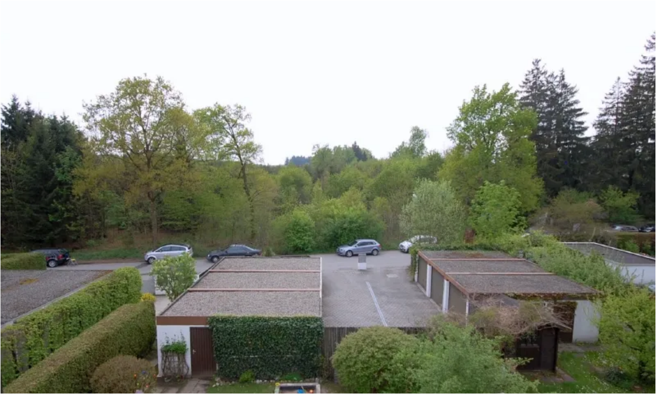
Ausblick von Terrasse