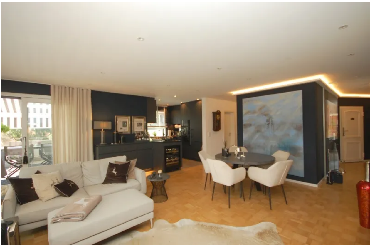
Wohnraum mit offener Küche