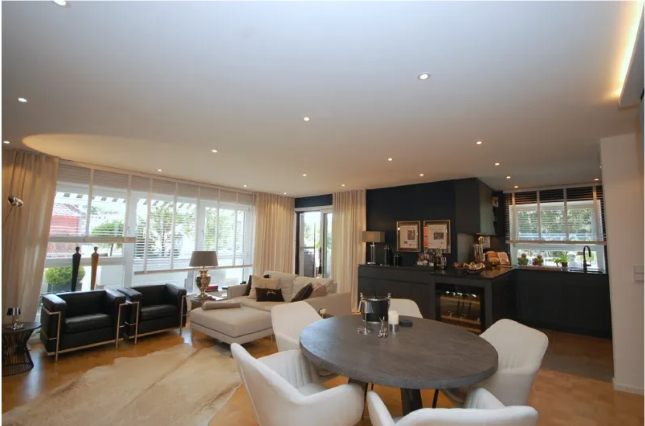
Wohnraum mit offener Küche