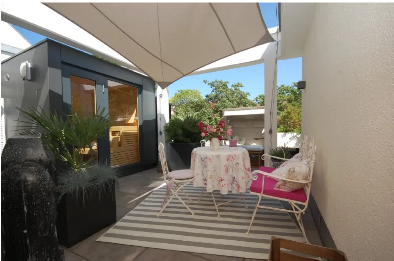
Terrasse vor Sauna