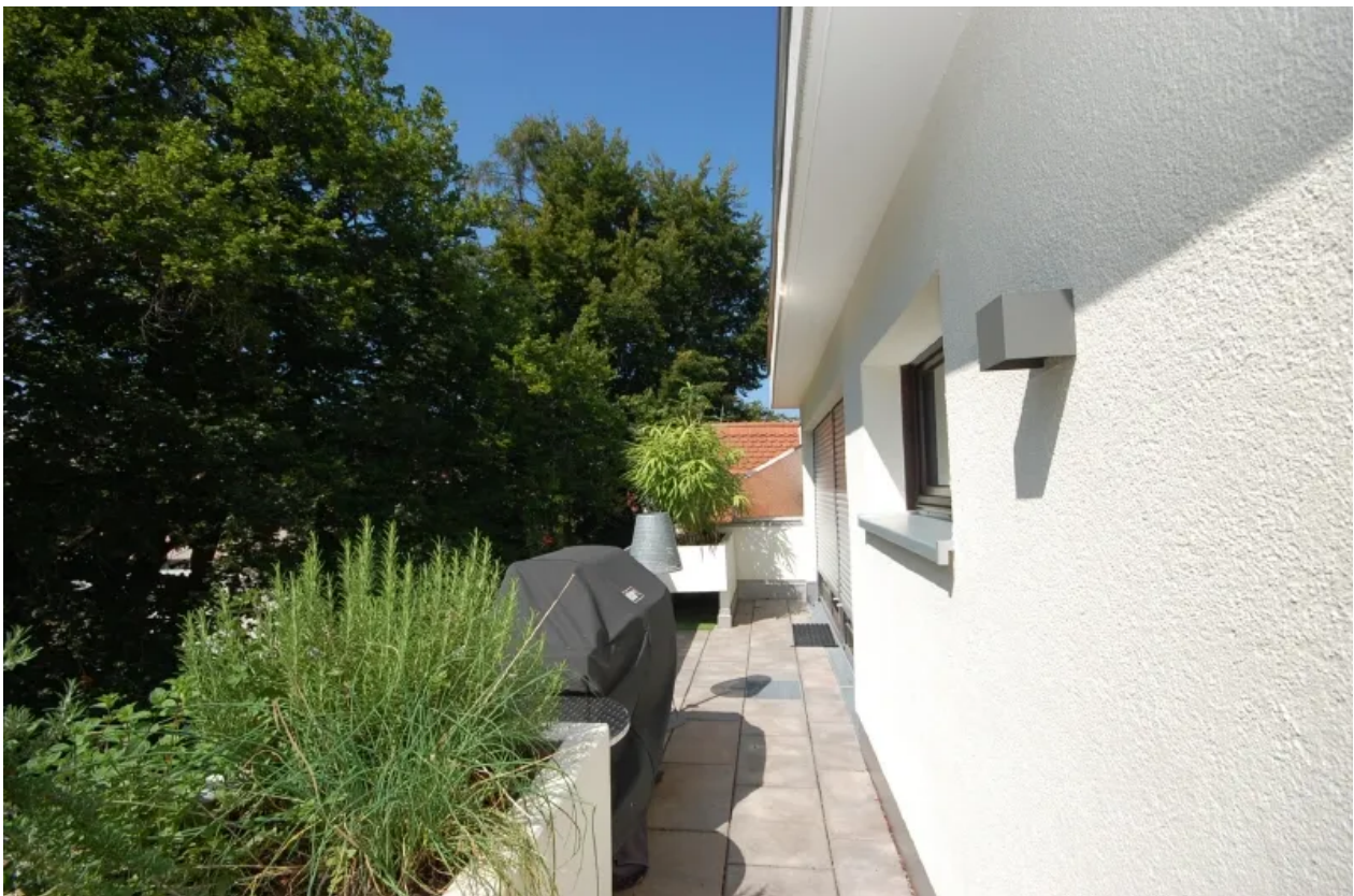
Westterrasse Bild 6